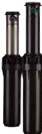
I-25-06 Altura total: 26 cm Altura de emergencia: 15 cm Diámetro expuesto: 5 cm Conexión: 1" BSP