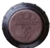
I-25 Alta Velocidad Disponible como opción instalada de fábrica en todos los modelos de acero inoxidable