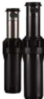
I-25-04 Altura total: 20 cm Altura de emergencia: 10 cm Diámetro expuesto: 5 cm Conexión: 1" BSP