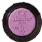
I-25 Agua Reciclada Disponible como opción instalada de fábrica en todos los modelos